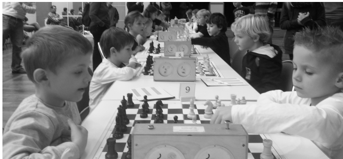
Die Jüngsten spielten in Ettlingen.