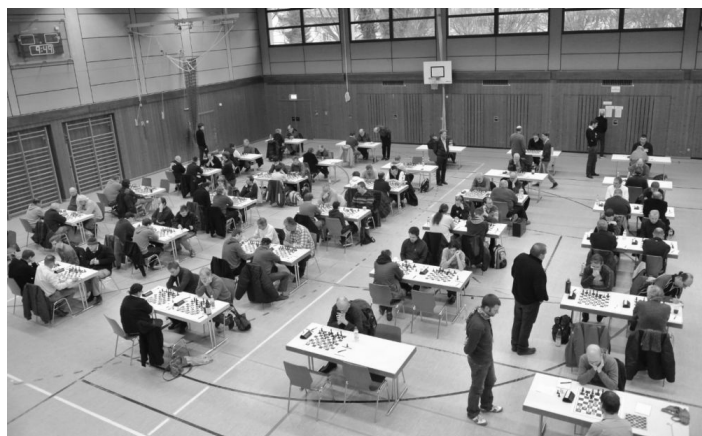
Blick auf den Turniersaal, A-Turnier