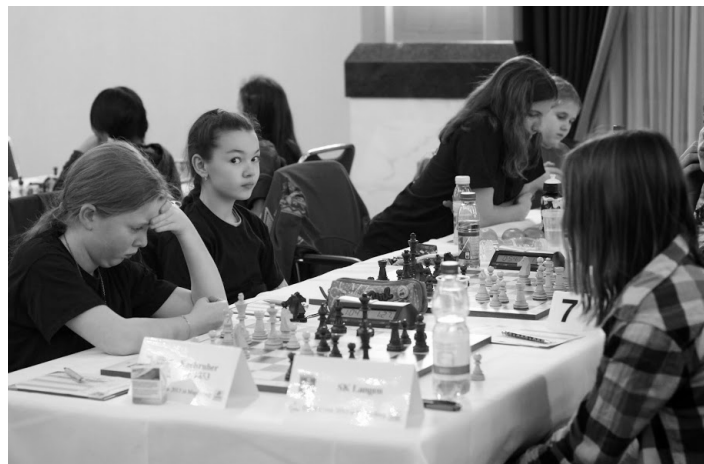
Die U14w; mal einen Blick riskieren ...

Für unsere U10, U14 und U14w ging das Turnier in Magdeburg allerdings früher als geplant am 29. Dezember zu Ende: »Die DVMs in Magdeburg in den Altersklassen U10, U14 und U14w wurden offiziell vom Gesundheitsamt in Person des zuständigen Amtsarzt Dr. Hennig abgebrochen. Der Ausbruch einer Norovirus-Epidemie wurde festgestellt.« (DSJ) Wir wünschen allen Betroffenen gute Besserung!