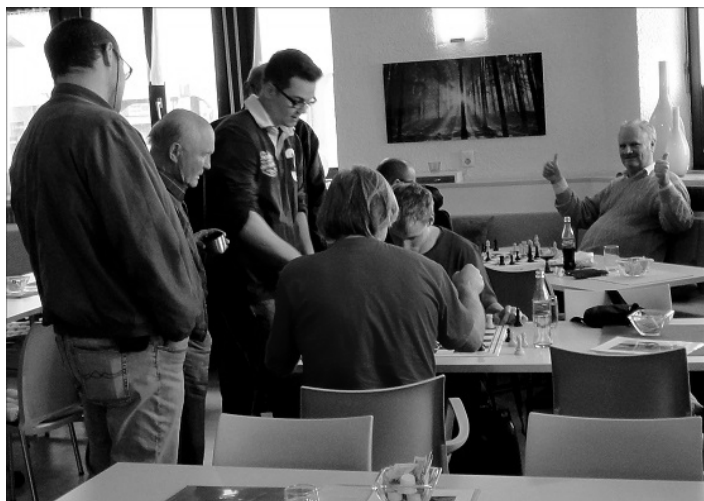
Meisterschaften im Treffpunkt Gambrinus in Rheinfelden (Baden)