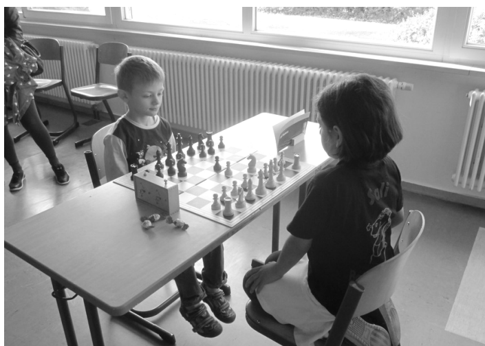
... bisher läuft es ja prima!