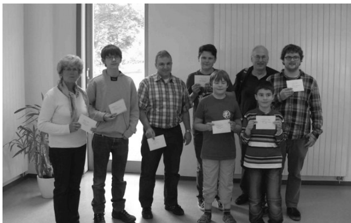
Die Sieger des 1. Ortenau-Opens