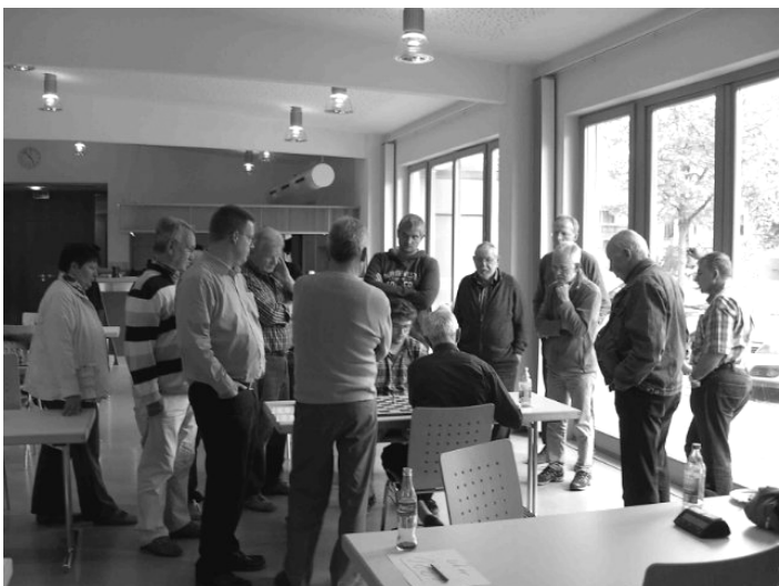
... es scheint interessant zu werden!