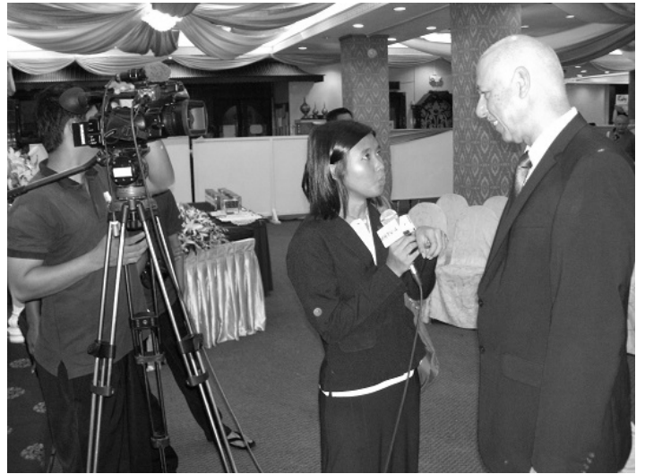
Eine große Zahl von Medien-Vertretern war bei diesem Event zugegen, womit das starke Interesse bekundet wurde, das es in Myanmar an einer weiteren Öffnung des Landes gibt.