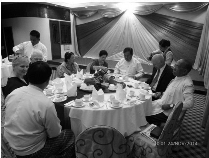
»Beim kleinen Staatsbankett« ...