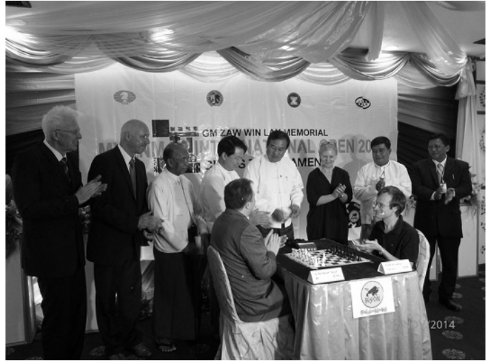
Den Startschuss zur ersten Runde gab Sportminister U Thaung Htike, indem er die Partie an Brett 1 mit e2-e4 eröffnete.