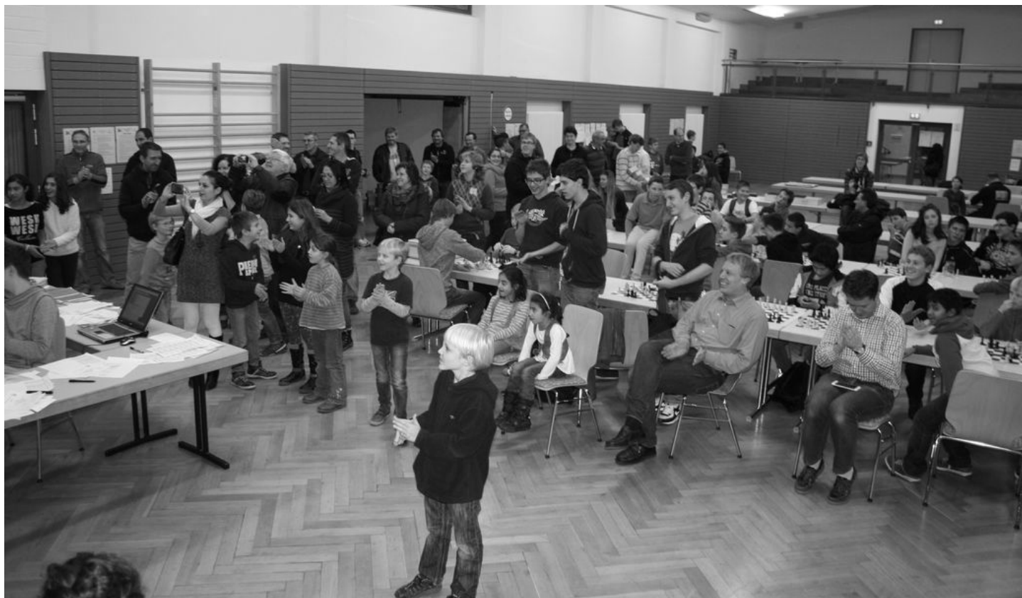
Bei der Siegerehrung