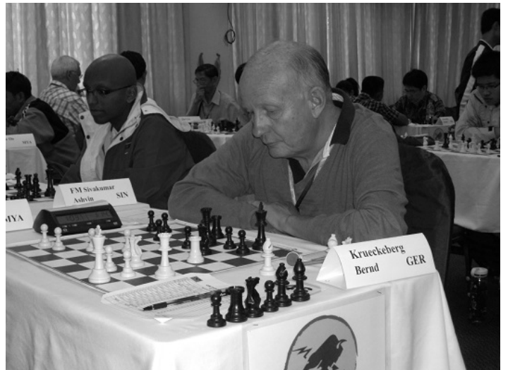
... und dann wurde Schach gespielt ...