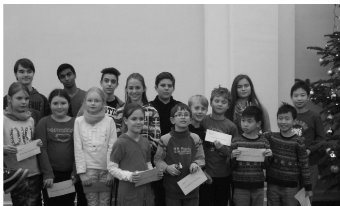
Die Gruppe der Preisgewinner.