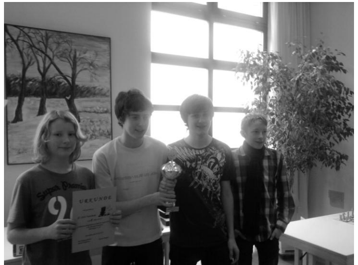
Bezirksmeister wurde die Mannschaft vom SC 1934 Viernheim

Die (zu) späte Absage der SV Hockenheim hat niemand verstanden!