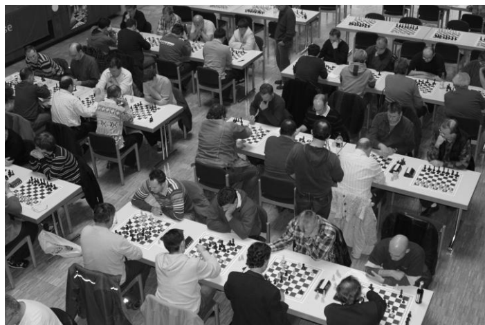
Blick über ungefähr die Hälfte des Starterfeldes.