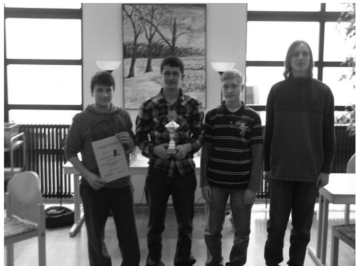
SK Mannheim 1946, Platz 2

Von der Mannschaft des 1922 SC Ketsch gibt es leider kein (gelungenes) Foto von der Siegerehrung.