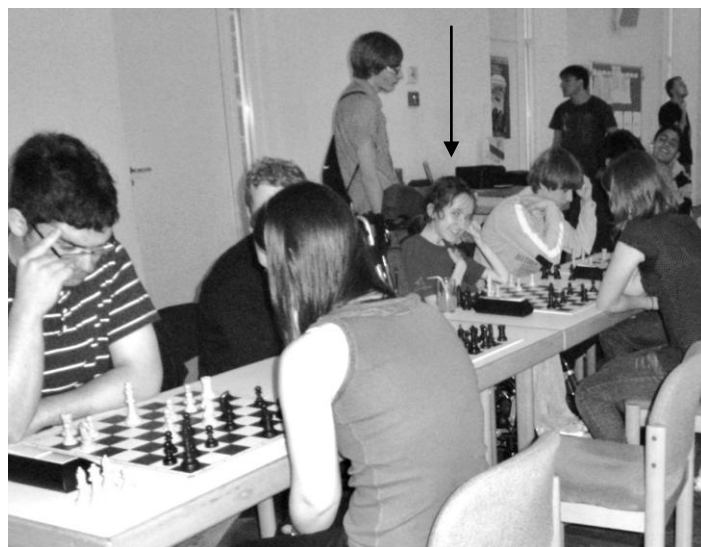
Für einen kleinen Flirt mit der Kamera sollte man immer Zeit haben.