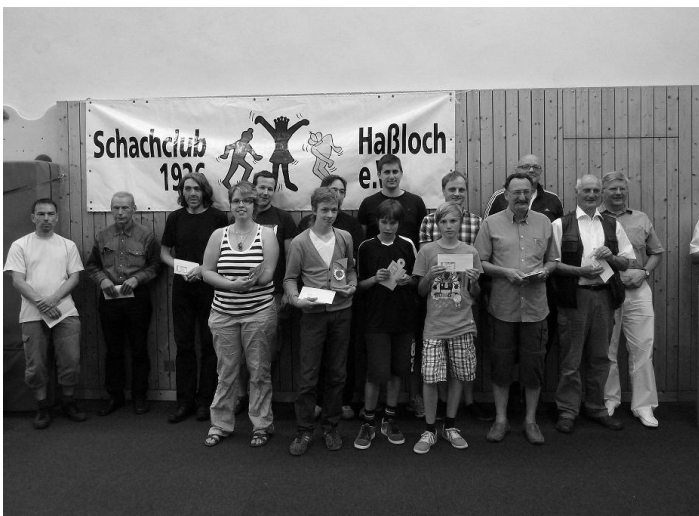
Gruppenbild der Sieger vom B-Turnier (Senioren, Jugend und Gesamtwertung).