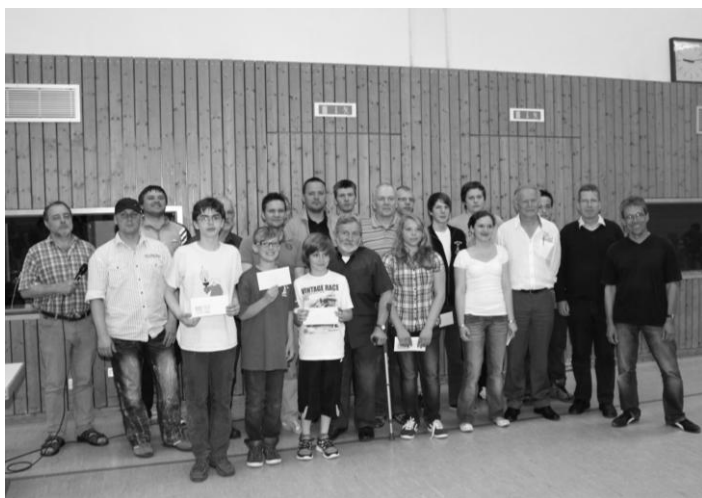
Gruppenbild der Gewinner in den einzelnen Kategorien