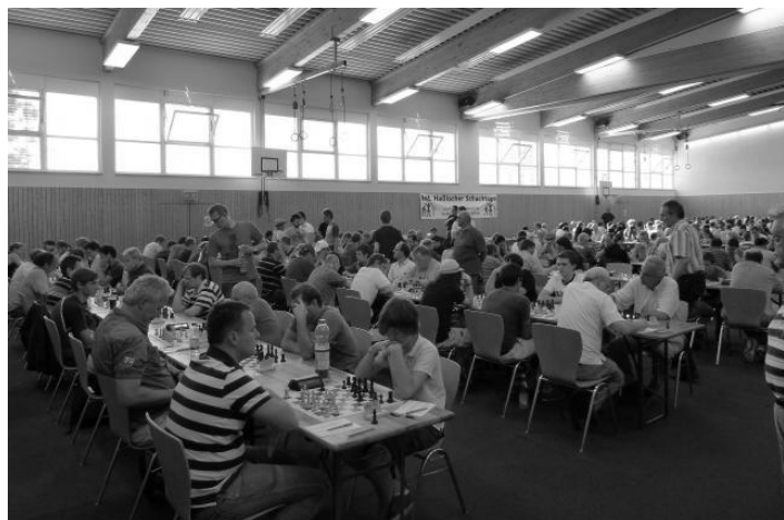
Blick auf das A-Turnier.