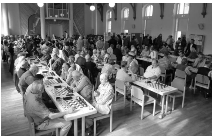
Das Feld möchte – aber darf noch nicht ...