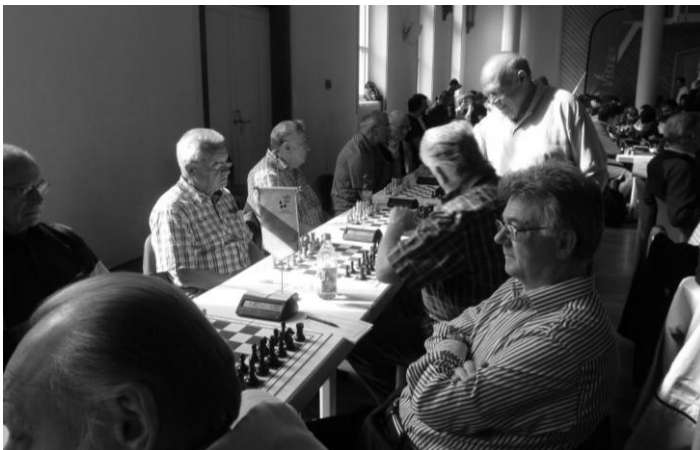
Senioren haben die Ruhe weg ...