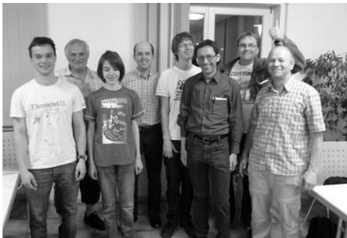
Das Meister-Team! Bericht und Foto: Vereinshomepage

Mit einer geschlossenen Mannschaftsleistung eines jeden Spielers haben wir verdient die Meisterschaft in der Bezirksklasse Ortenau erreicht.