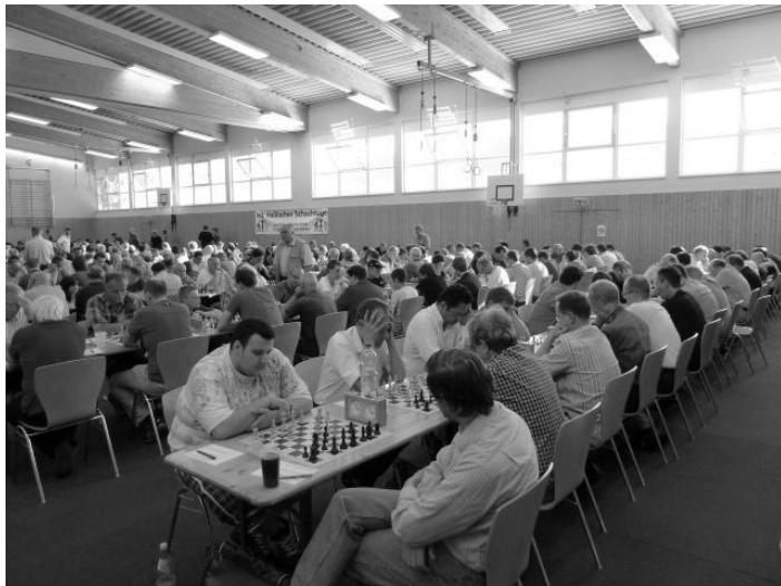
Blick auf das B-Turnier, 1. Runde