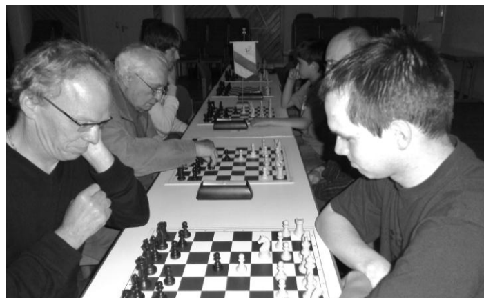
Das (kleine) Teilnehmerfeld