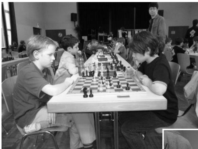
Foto-Galerie zum 3. Karlsruher Jugend-Open