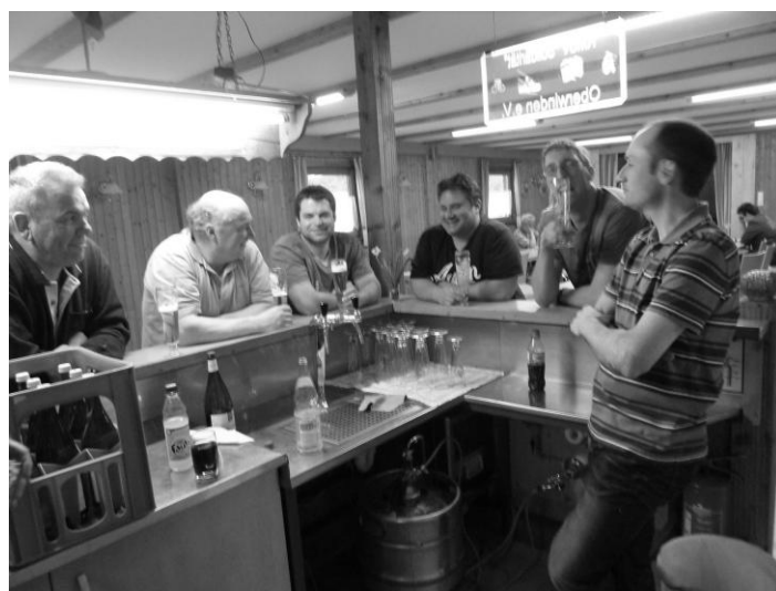
Bericht und Fotos: Homepage des SC Oberwinden