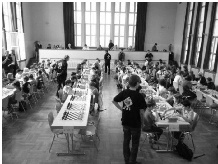
Blick in die Halle und auf das Teilnehmerfeld.

Dieses Foto und die folgende Foto-Serie entstammen der KSF-Webseite.