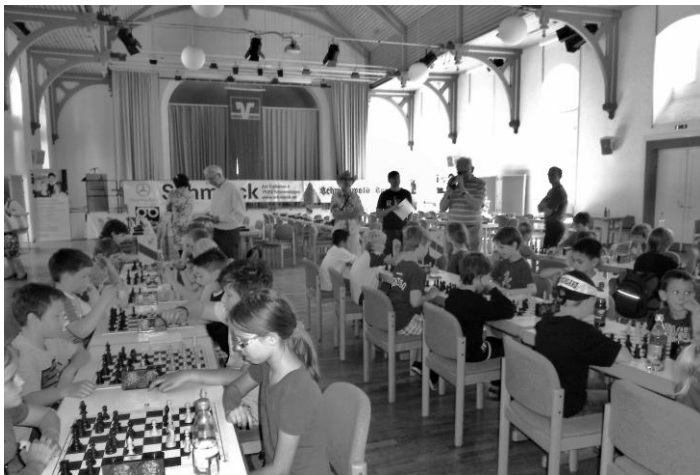
Blick auf das Teilnehmerfeld