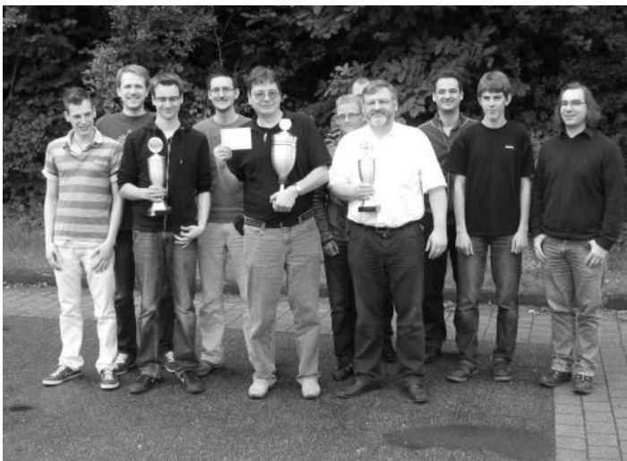
Pokalsieger der Mannschaften aus den unterschiedlichen Klassen.

Schachclub 1948 Ersingen: 37. Ersinger Sommerturnier