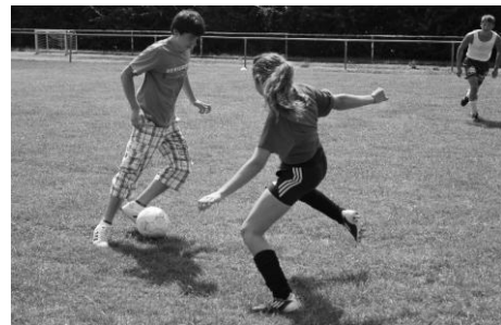
Bericht: Karlheinz Eisenbeiser

Im Finale setzte sich erst nach Verlängerung und Elfmeterschießen der Deutschkurs Stufe 2 vor dem Deutschkurs Stufe 1 durch. Im kleinen Finale bezwang das Team Einbach den gastgebenden Schachclub BG Buchen. Da das Turnier auf positive Resonanz stieß, ist geplant, den Doppelwettbewerb im nächsten Jahr zu wiederholen.