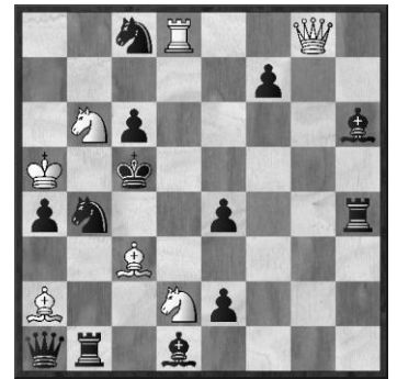
Nr. 2: R. Büchner