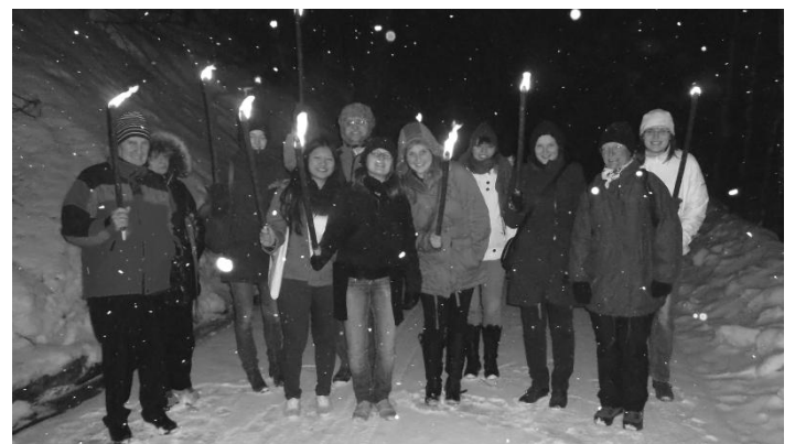
Im Rahmenprogramm: Frühlingswanderung am Tegernsee ...