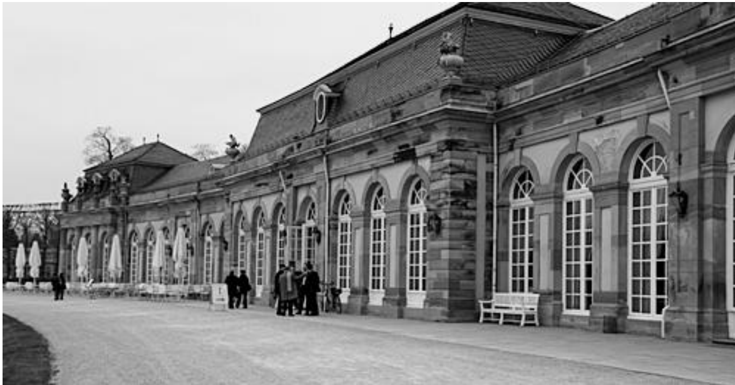
Das »Spiellokal«, der Nordzirkel des Schwetzingen Schlosses.