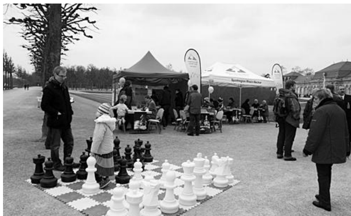
Stand der DSJ