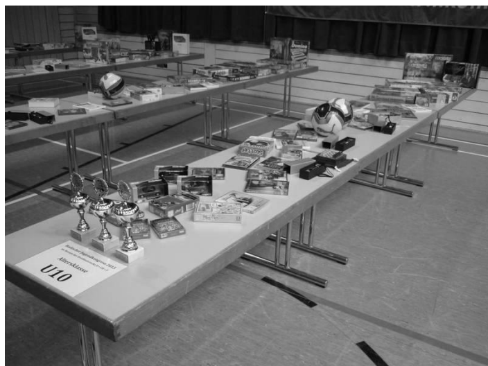
Die reich gedeckten Gabentische ...