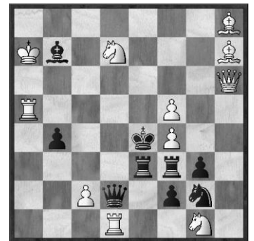
Nr. 4: L.A. Issajew