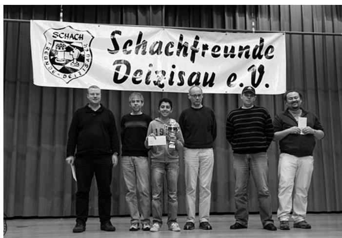
Siegerehrung zum B-Turnier