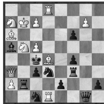
Nr. 3: H. Ahues