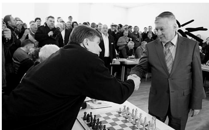
Ein Händedruck, bevor das »Katz-und-Maus-Spiel« begann ...