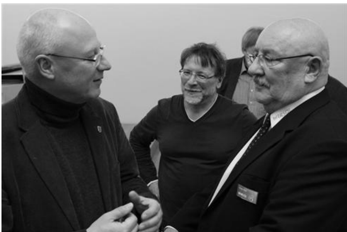
Kontakte pflegen war angesagt ...