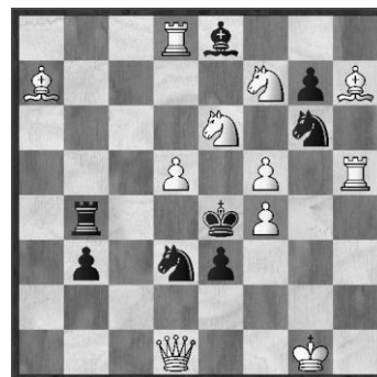
Nr. 5: M. Adabascheff